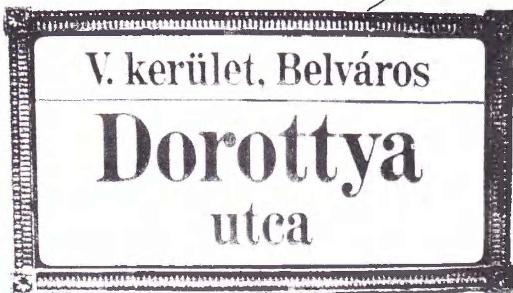
Zománcozott utcatábla, írtótt kerettel